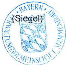
Reiner Dunkel Erster Bürgermeister