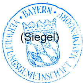
Reiner Dunkel Erster Bürgermeister